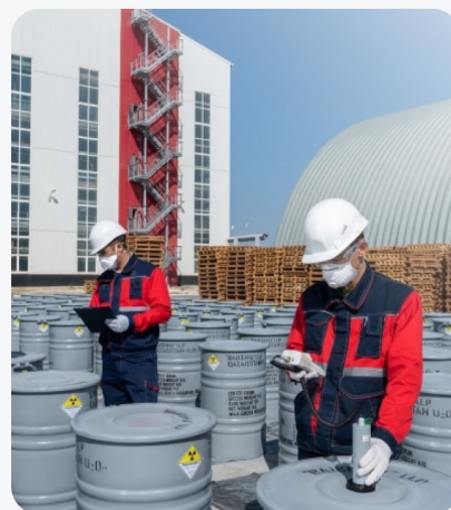
Добыча урановой руды