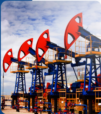
Добыча нефти, переработка и сервис