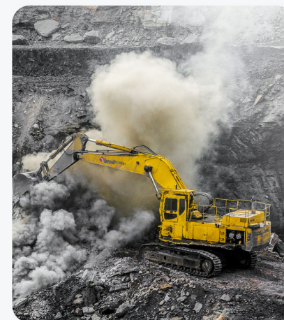
Добыча твердых ископаемых